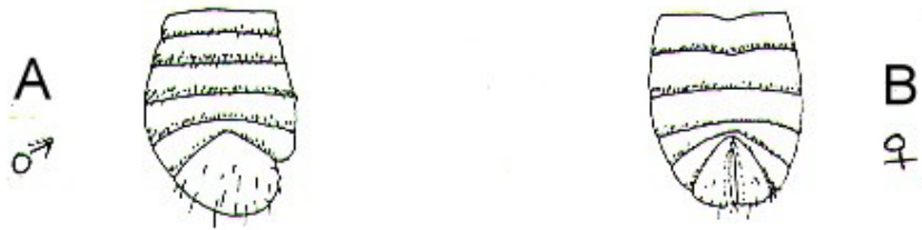
گونه Encarsia formosa Gahan (Hymenoptera: Aphelinidae)